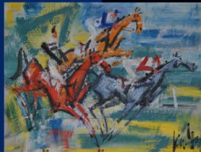
Gen Paul Course hippique Panneau signé en bas à droite D'un ensemble de trois œuvres

MOBILIER XVII e , XVIII e , XIX e & DESIGN, OBJETS D'ART, TABLEAUX MODERNES