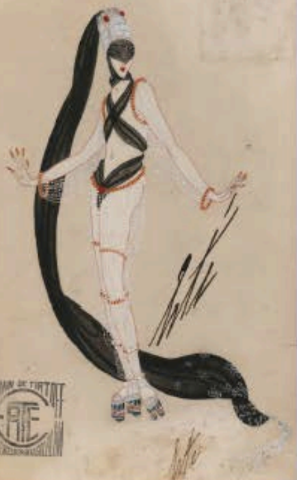
Erté Gouache originale, costume pour l'Orient Merveilleux D'un ensemble d'une dizaine d'œuvres